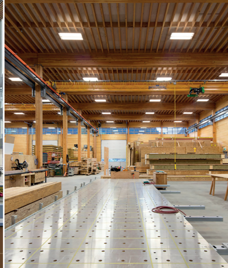
Productie vervaardigen van producten, logistiek, magazijn, output gericht