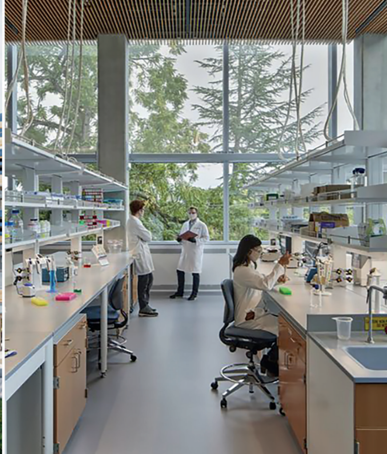
Research & Development labs, testcenter, experimenteren