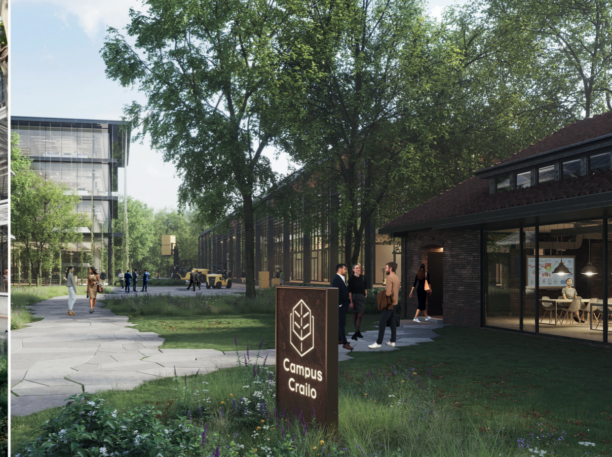
Artist impression De Corporate Campus zoals gevisualiseerd in de stedenbouwkundige visie

Crailo biedt ruimte voor kwaliteit en uitstraling