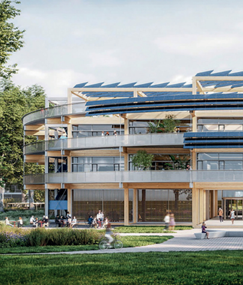
Hoofdgebouw de ultieme Corporate Campus