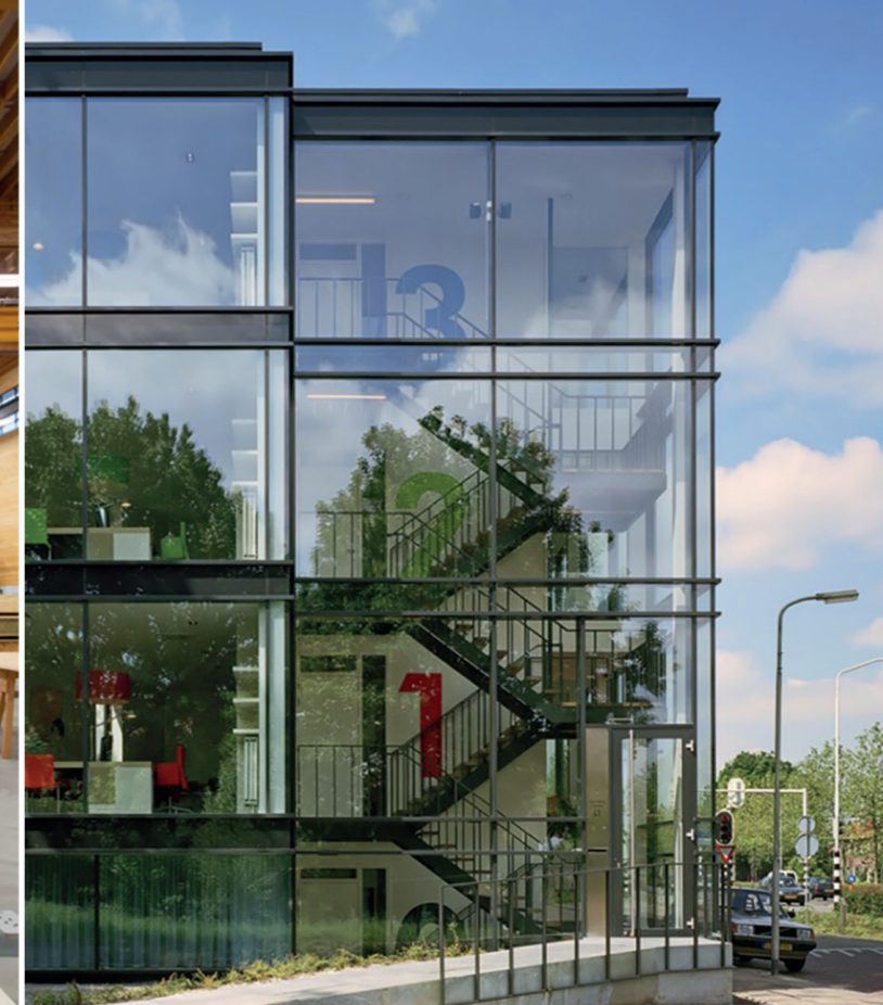
Etalage start-up lane, demo, expositie