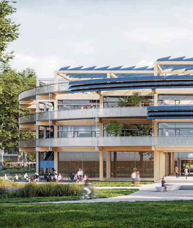
Hoofdgebouw de ultieme Corporate Campus