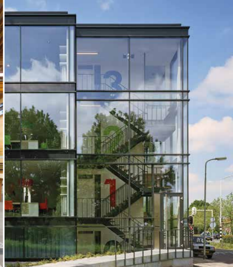
Etalage start-up lane, demo, expositie