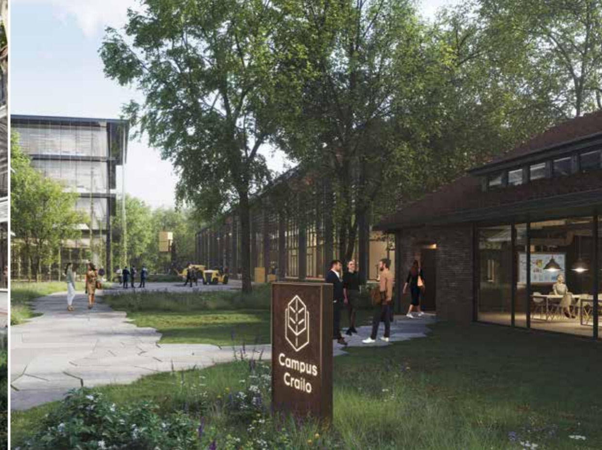
Artist impression De Corporate Campus zoals gevisualiseerd in de stedenbouwkundige visie

Crailo biedt ruimte voor kwaliteit en uitstraling