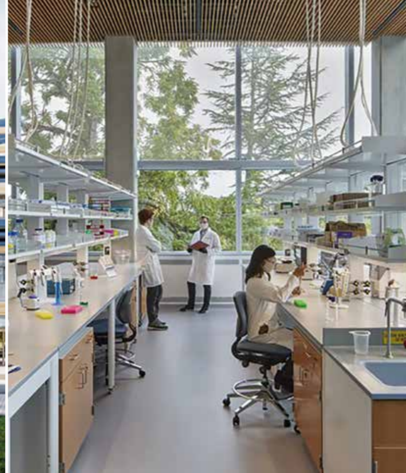
Research & Development labs, testcenter, experimenteren