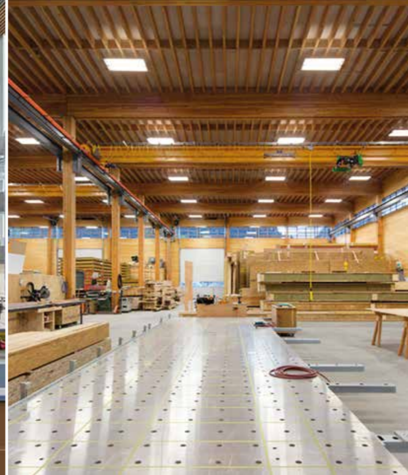
Productie vervaardigen van producten, logistiek, magazijn, output gericht